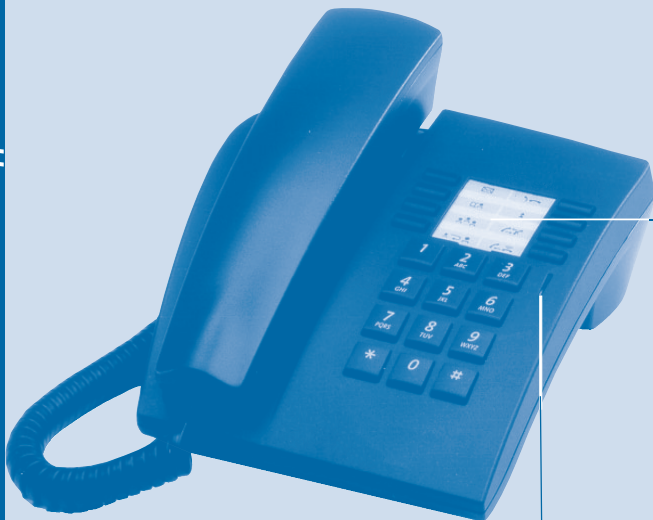
Die LED zeigt das Vorhandensein von Nachrichten oder Rückrufanforderungen an.